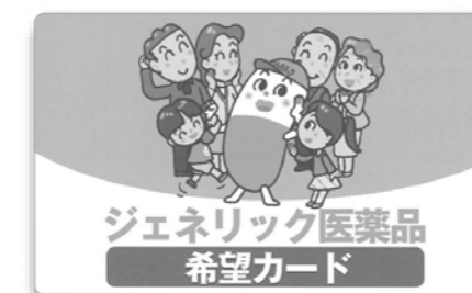
〈ジェネリック医薬品希望カード〉

※治療内容によっては、医師が新薬が適切だと判断し変更できない場合もあります。 ※3月末までに全ての被保険者の方へお送りする予定です。