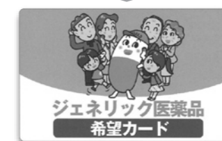
〈ジェネリック医薬品希望カード〉

「ジェネリック医薬品希望カード」を医師や薬剤師に提示することで、その意思を伝えることができます。